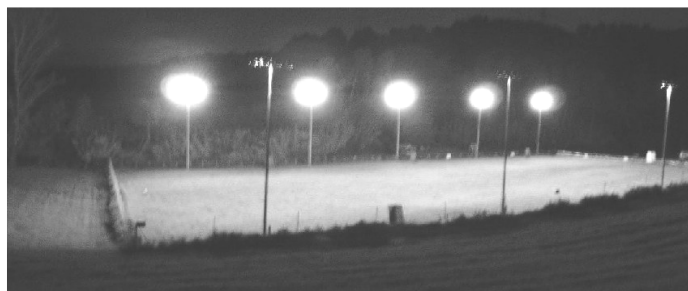
Vista nocturna de las instalaciones 40.000 W